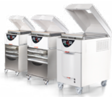
K2, K3, K4