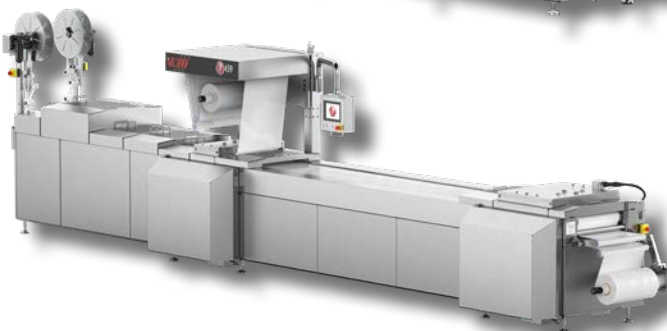
VERPACKUNG-ETIKETTIERER FÜR OBER-UND UNTERSEITE